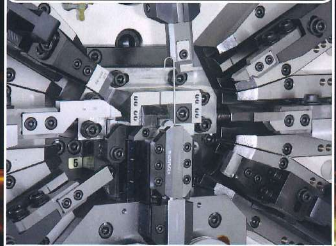
広い加工空間 / Wide Manufacturing Space